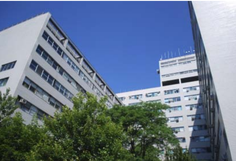
KEN HYGIENE SYSTEMS salg varetages af egne selskaber i Norden og repræsentationer i over 40 øvrige lande.

Blandt vore primære kundegrupper er sygehuse i det meste af verden - baseret på bl.a. vort samarbejde med mange af de danske sygehuse.