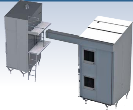
Equipment Washer Disinfector 1000