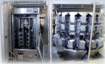
Hopper Cleaner 948