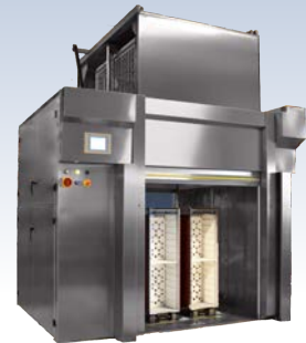
Trolley Cleaner 910 R