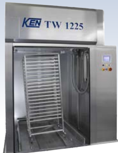
Trolley Washer 1225