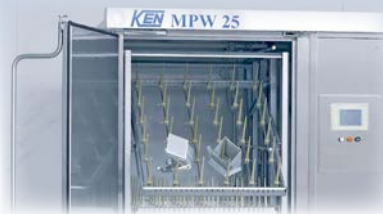
Multi Purpose Washer 25