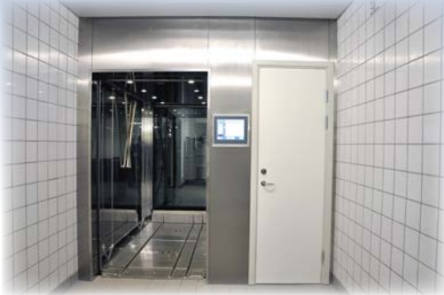
Cart Washer Disinfector 5000