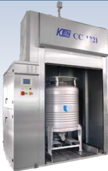
Container Cleaner 1221