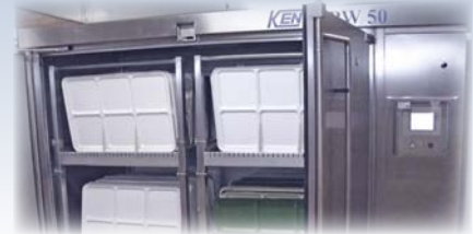
Multi Purpose Washer 50